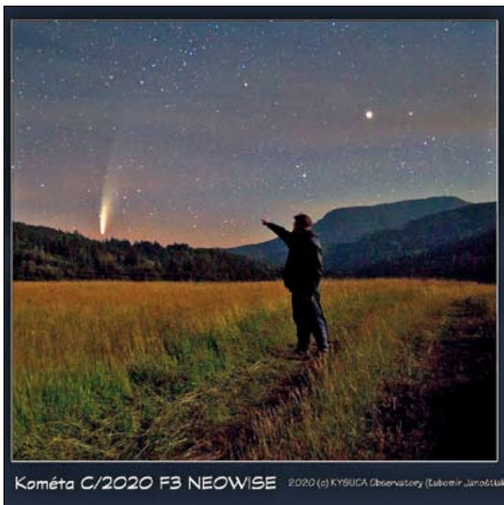
Kométa C/2020 F3 NEOWISE 2020

nočnej oblohe žiarit veľkú kométu Hale-Bopp a súhvezdia Orión. Veľmi ma to nadchlo a vďaka tomu som sa začal venovať astronómii a študovať rôzne knihy. Podobne, ako keď niekto dostane ako by „osvietenie“, že je to jeho poslanstvo a cesta. Mojou najobľúbenejšou knihou je kniha „Hviezdy a planéty“ od autora Patrick Moore. Táto kniha poskytuje všetky informácie potrebné pri pozorovaní nočnej oblohy.