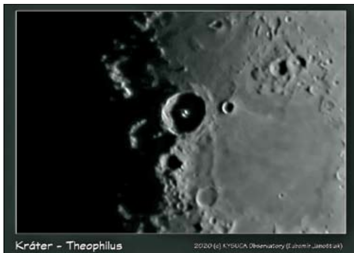
Kráter - Theophilus